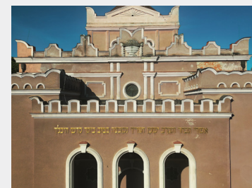
NOVÁ ORTODOXNÁ SYNAGÓGA ĽUDOVÍT OELSCHLÄGER, 1927