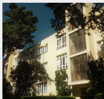
MASARYKOVA KOLÓNIA BANKOVÝCH ÚRADNÍKOV JOSEF POLÁŠEK, 1931