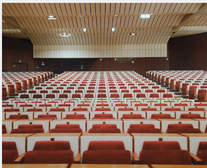
MAGISTRÁT MESTA KOŠICE MILAN MOTÝL, 1985