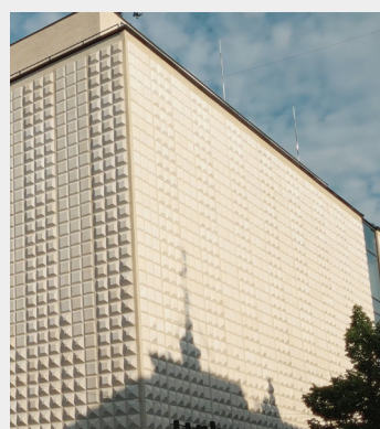
OBCHODNÝ DOM URBAN / PRIOR RŮŽENA ŽERTOVÁ, 1968