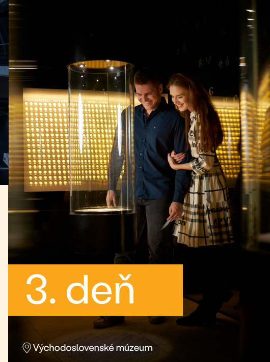
📍 Východoslovenské múzeum

Podvečer si rezervujte na návštevu jedinečného parku Kasárni/Kulturparku . Areál bývalých vojenských kasární prešiel rozsiahlou rekonštrukciou a stal sa novým stánkom kultúry v meste v roku 2013, kedy sa Košice spolu s Marseille stali na rok Európskym hlavným mestom kultúry. Súčasťou areálu je pokojný park s Kaviarňou Papa , kde vám radi ponúknu lokálne produkty. V Kulturparku sa na viac počas celého roka konajú rôznorodé kultúrne podujatia – výstavy, koncerty, stand-upy.