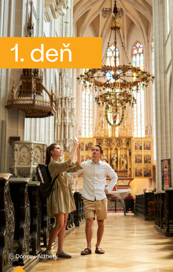
📍 Dóm sv. Alžbety

Ak chcete pochopiť, čo je na Košiciach výnimočné, musíte začať Hlavnou ulicou. Zastavte sa na Hlavnej 59 vo Visit Košice Infopointe – vašej vstupnej bráne k poznávaniu mesta, kde si môžete vyzdvihnúť šikovné mapy, overené rady a tipy na program, užitočné informácie, ale aj dohodnúť prehliadku mesta podľa vlastných predstáv. Fanúšikov umenia tu navyše očarí jedinečné multimediálne dielo planet košice 2121 s odkazom na titul UNESCO Creative City of Media Arts.