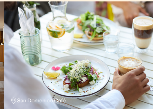
San Domenico Café