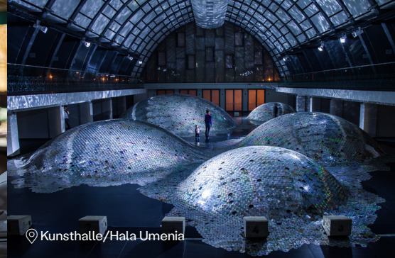
📍 Kunsthalle/Hala Umenia