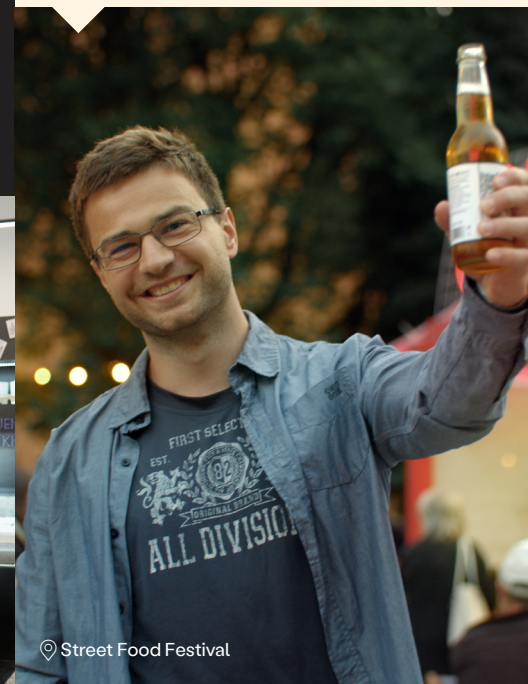
Street Food Festival

Ak na svojich cestách radi skúšate lokálne pochútky, v Košiciach vás miestni určite pošlú na legendárny hot-dog Robinček , ktorý pripravuje partia z food trucku Robin Street Food pred populárnym Kinom Úsmev. K hot-dogu si doprajte aj lokálne limonády a sajdre Opré!