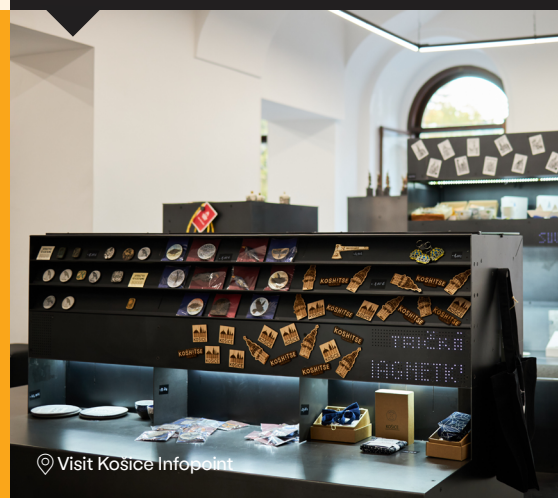
Visit Kosice Infopoint

Naskenujte tento QR kód a listujte v zozname praktických informácií o návšteve mesta.